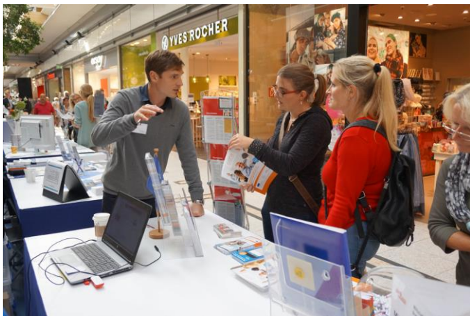
Aussteller im Gespräch mit Bildungsinteressierten